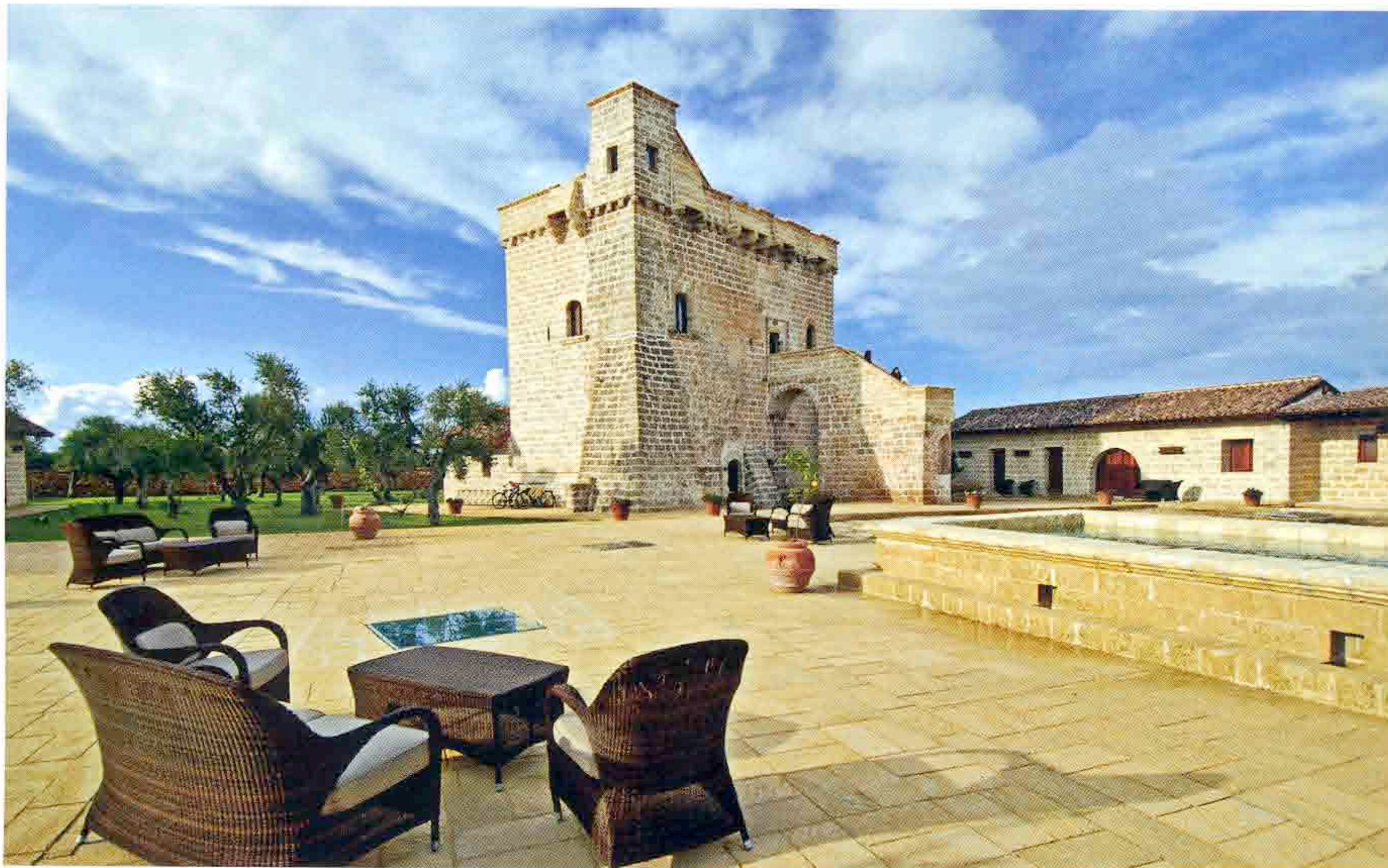
Sopra, la Torre del Duecento di Tenuta Monacelli, a Casalabate. Le 23 camere sono state ricavate da due masserie fortificate, circondate dagli ulivi. Doppia da 180 euro.

alla volontà di privati che hanno acquistato e ristrutturato case fatiscenti. Tra via Terra, via San Giuseppe e Casale è nato il Tozzi Village : sette appartamenti che conservano elementi originari come i caminetti in pietra, le travi a vista, le nicchie nel muro.